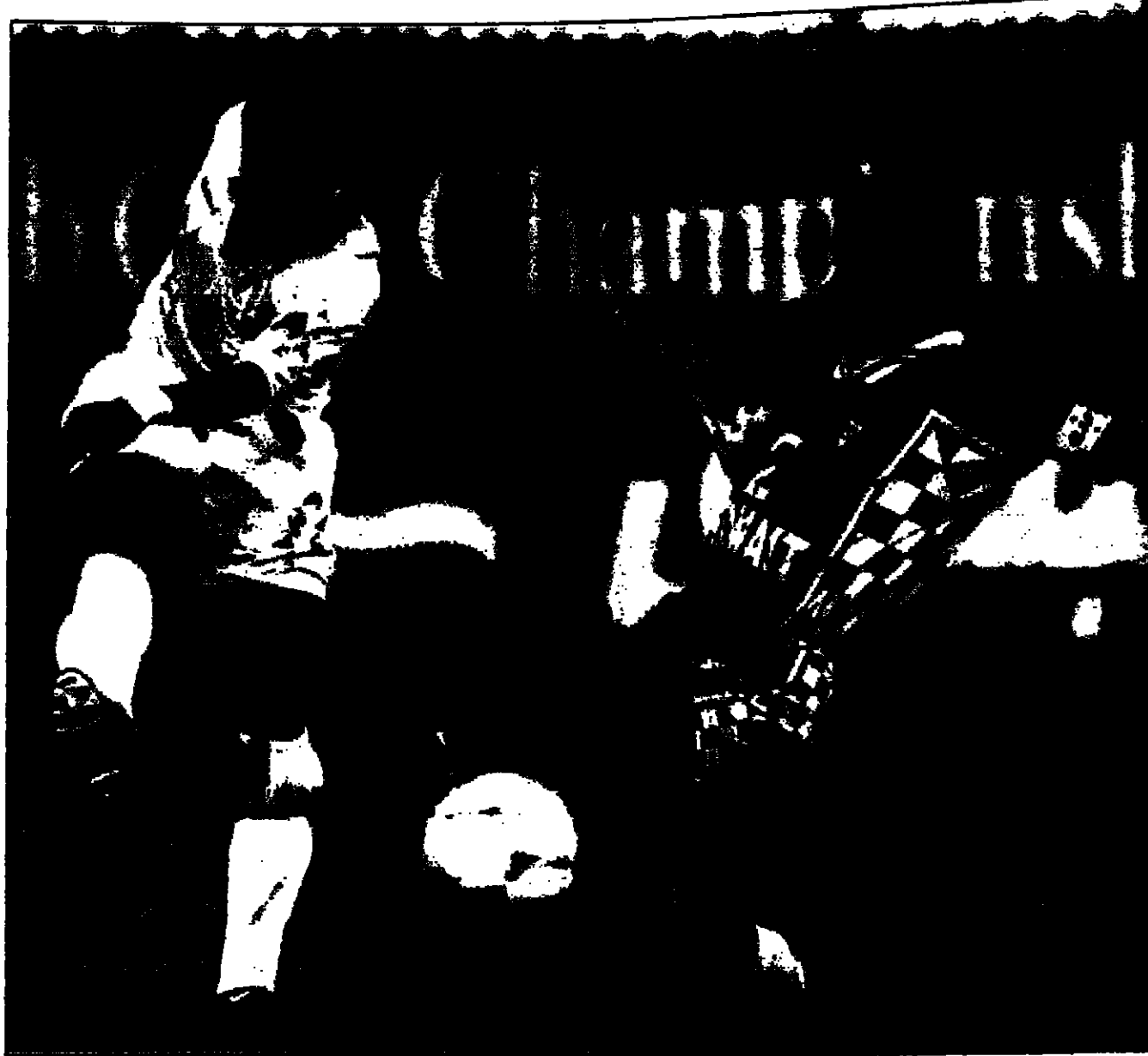
لحظة من مباراة الفريق السعودي